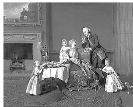
1 Rijke familie aan de thee

Dat is de start van de lezing over de geschiedenis van onze dranken. Ze heeft als Titel: Wat is de overeenkomst tussen aardappeleters en koffiedrinkers.