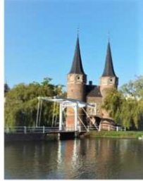
Dinsdag 2 mei