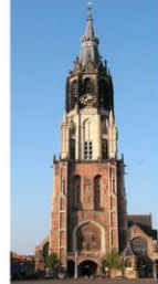
€ 47,50 p.p.

Delft is een eeuwen oud stadje, beroemd om zijn schilderachtige aardewerk, kerken en historische straatjes met winkeltjes en terrasjes. U wordt ontvangen met koffie/thee met gebak en u ontvangt een combikaartje voor het bezoek van de Oude- en de Nieuwe Kerk. De laatste is vooral bekend door de grafkelder van het Koninklijk Huis. U kunt op eigen gelegenheid Delft ontdekken.