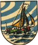
Broek op Langedijk