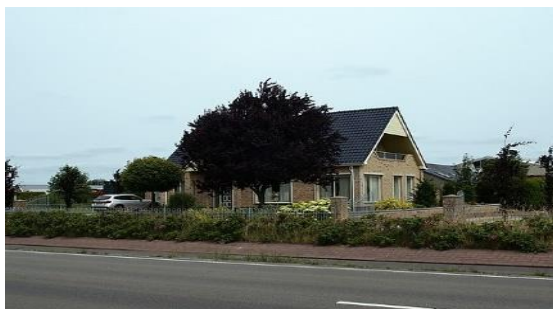
"levensloopbestendige woning" ??

De toegang is gratis. Ook niet leden zijn van harte welkom.