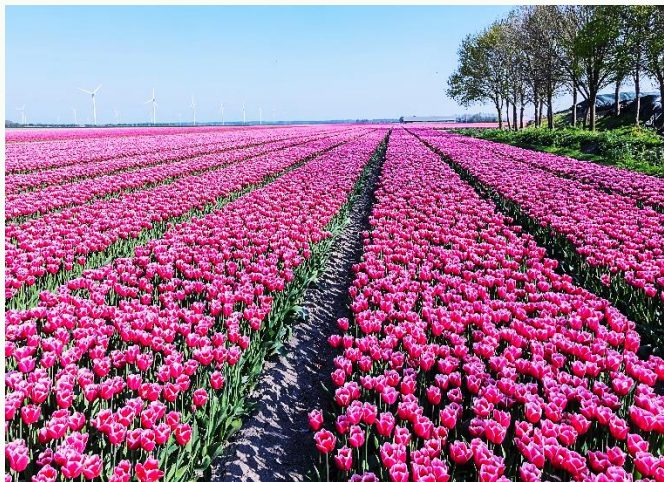
Een violet tulpenveld in de Flevopolder (T.H.)