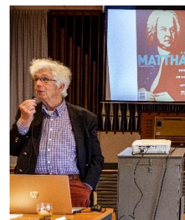
2 meesters op 1 foto

We krijgen door zijn uitleg een beter beeld van Bachs werk en het denken van deze grote musicus. Het verhaal was zeer boeiend en we hebben nog maar een stukje uitleg gekregen. Nu eerst eens goed naar de hele Matthäus Passion gaan luisteren dit weekeinde.