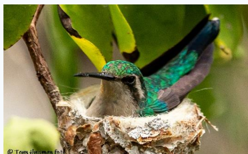
Kolibri op nest, T.H.

Inleveren a.u.b. uiterlijk vrijdag 13 mei a.s.