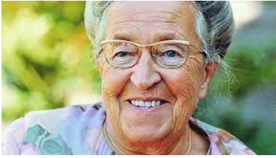
Corrie ten Boom

Te midden van al die ellende had David zijn harp genomen en gezongen: 'Leg uw last op de HEER en Hij zal u steunen' (Psalm 55:23).