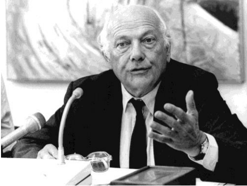
Joop den Uyl