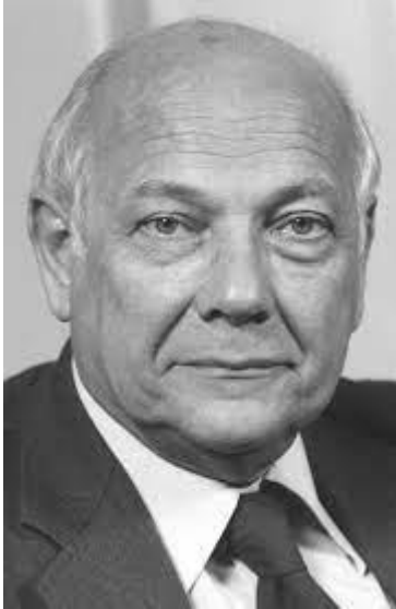
Joop den Uyl

Als alle mensen op de wereld evenveel grondstoffen zouden verbruiken als wij Nederlanders zou er drie keer zoveel nodig zijn als de aarde produceert. Dan denk ik: een soort Joop den Uyl moest nu toch maar eens gaan zeggen dat we zuiniger moeten doen.