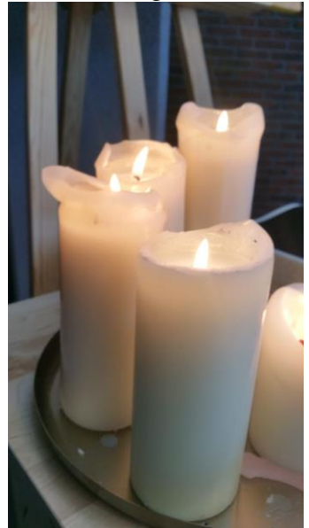
Licht voorangst en verdriet

schuilkelders, de mensen op de vlucht komen bij mij binnen, net als in de Tweede Wereldoorlog. Ik vraag mij af: Wanneer en voor welk land moet je om vrede bidden? God erbarm U over deze Wereld! En meteen komt het lied van Jenny Arean en Frans Halsema bij mij boven: 'Vluchten kan niet