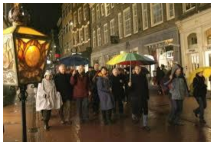
Stille omgang Amsterdam

Door een nacht, van smart en zorgen Schrijdt een stoet van pelgrims voort Liederen zingend van de morgen Waar het nieuwe licht weer gloort God is/gaat zelf vooraan geschreden Hij verlicht, verlost heel Zijn volk Baant het pad dat wij betreden En verjaagt de donkere wolk God, dat uitzicht van verblijden Aan de verre eeuwige kust Waar U ons heen wilt leiden Naar het licht van vrede en rust