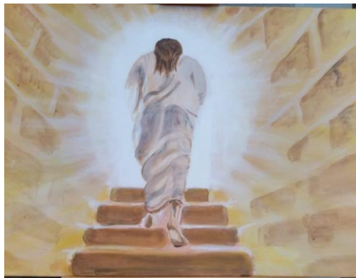
Pasen: Naar het Licht

Er zijn gelukkig veel acties, nog steeds zijn er inzamelingen en mensen die hun huis open zetten voor vluchtelingen. Hoe mooi is het, dat er zoveel hulp is, dat we dat kunnen doen vanuit onze opdracht: ‘Omzien naar elkaar.’ De miljoenen mensen en kinderen, allemaal op de vlucht, het lijkt ver weg, maar altijd en nu vooral zo dicht bij. Vluchtende mensen, zoeken een schuilplaats, schuilen waar naar toe?