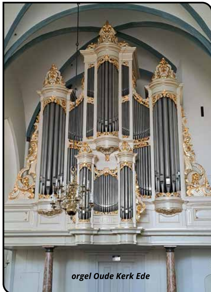
orgel Oude Kerk Ede

Maanderweg 70, Ede Tel. 0318 - 62 80 80 www.bolthofvandentop.nl