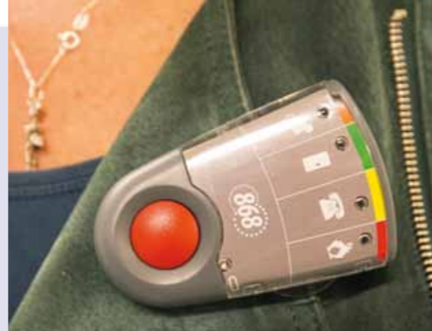
Makkelijk alarm slaan